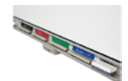
Интерактивный лоток для маркеров